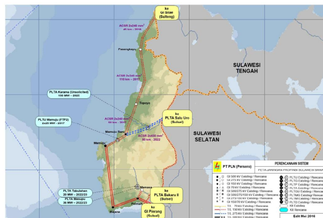
Gambar 2. Peta Jaringan Ketenagalistrikan Provinsi Sulawesi Barat [1]

Pemenuhan kebutuhan daya listrik dipenuhi melalui pembangunan sejumlah pembangkit baru. Sistem ketenagalistrikan Sulselbar sendiri memiliki karakteristik yang unik. Mayoritas pusat-pusat pembangkit terletak di bagian utara. Hal disebabkan oleh ketersediaan sumber daya alam untuk pembangkitan listrik yang terletak di bagian utara. Adapun pusat-pusat beban termasuk keberadaan konsumen-konsumen daya listrik skala besar justru terletak di bagian selatan. Pembangunan pembangkit dengan letak yang sangat jauh dari pusat beban seperti PLTA Poso II di Provinsi Sulawesi Tengah, tentunya akan memberikan pengaruh terhadap kinerja sistem kelistrikan Sulselbar. Adapula pembangunan pembangkit baru yang berlokasi dekat dengan pusat beban yaitu PLTU Jeneponto-IPP. Pembangunan pembangkit ini juga tentunya juga akan memberikan efek terhadap Sistem Sulselbar. Analisis aliran daya perlu dilakukan untuk mengetahui kinerja sistem Sulselbar setelah pembangunan kedua pembangkit tersebut. Penelitian ini membahas tentang komparasi kualitas daya khususnya rugi-rugi daya pada Sistem Sulselbar untuk kondisi sistem terhubung dengan pembangkit yang jauh dari pusat beban (PLTA Poso II) dan kondisi sistem sudah terhubung dengan pembangkit yang dekat dengan pusat beban (PLTU Jeneponto IPP).